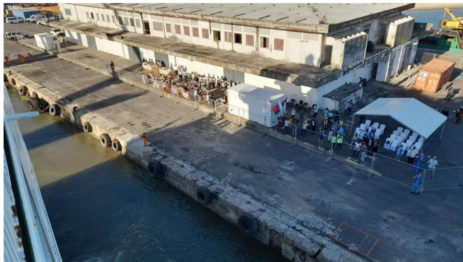
Het welkom dat ons opwachtte toen we onze ligplaats aan de kade binnenvoeren