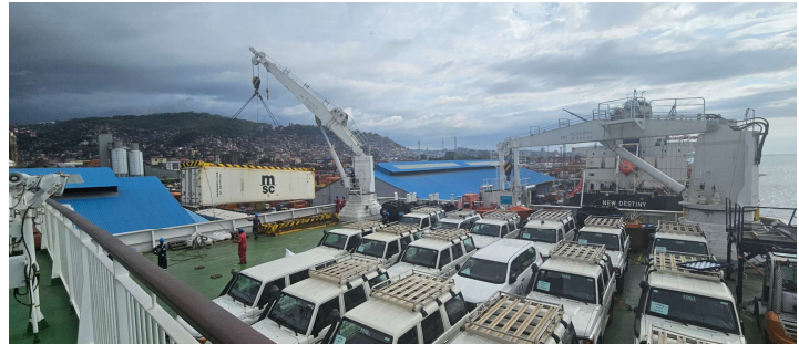
De auto's zijn geladen en de laatste container met bevoorrading is op 12 juni aangekomen! Net op tijd voor vertrek!