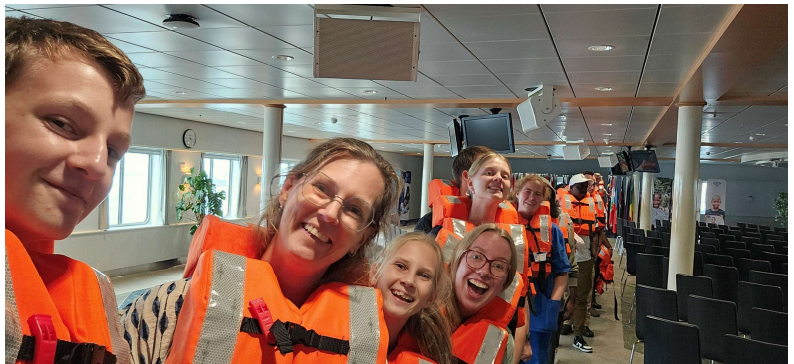
On-sea drill, goed om precies te weten wat te doen in geval van nood tijdens de vaart.